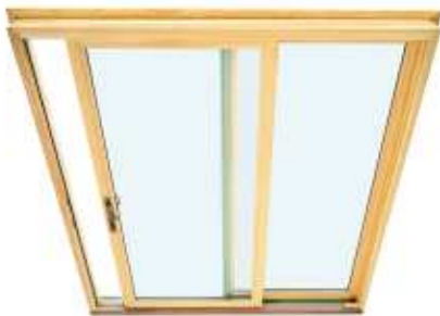
Baies coulissantes Sliding Patio Door