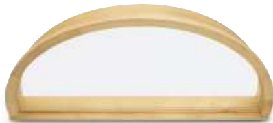
Châssis cintrés Round Top Window