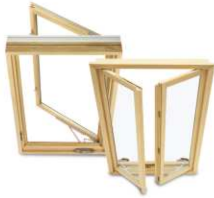
Pivotants verticaux Casemaster & French Casemaster Windows