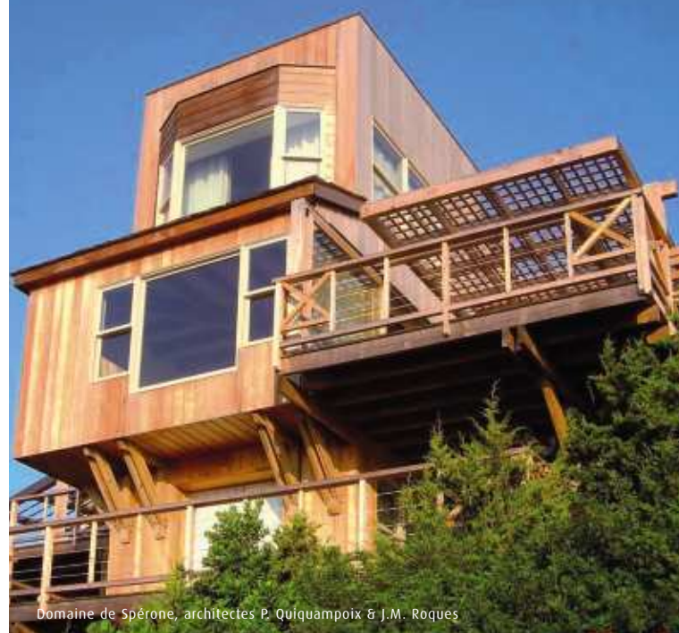
Domaine de Spérone, architectes P. Quiquampoix & J.M. Roques

Libre à vous d'imaginer un ensemble combinant fixes et ouvrants, ou bien de dessiner les petits bois qui personnaliseront vos ouvertures, ou encore de choisir un coloris d'aluminium pour une réalisation d'exception ! Quel que soit votre choix, les menuiseries MARVIN présentent une même qualité de finition et d'excellentes performances thermiques et phoniques. Alors à vous de jouer et de créer en toute sérénité !