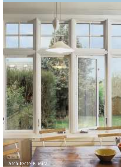
Architecte P. Mira