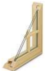
Petits bois rapportés, intérieur et extérieur