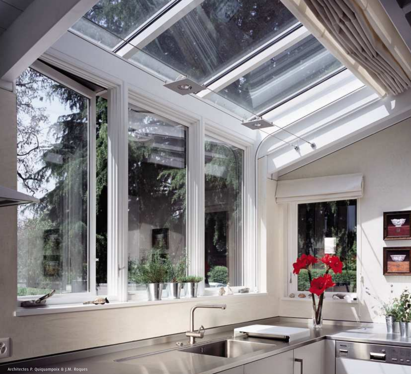
Architectes P. Quiquampoix & J.M. Roques