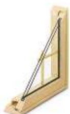
Petits bois intérieurs rapportés

Les folios bleus renvoient au guide technique.