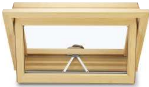
Pivotants horizontaux Awning Window