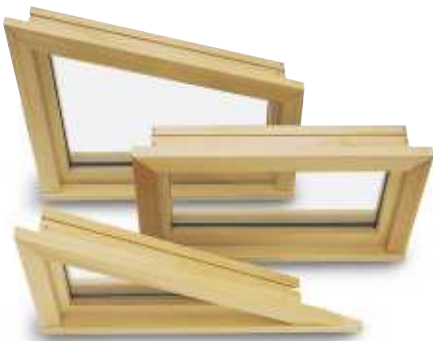
Polygones & autres formes Polygon & Special Shape Windows