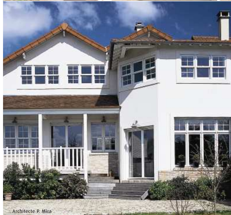
Architecte P. Mira