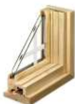
Petits bois en aluminium intégrés dans le vitrage