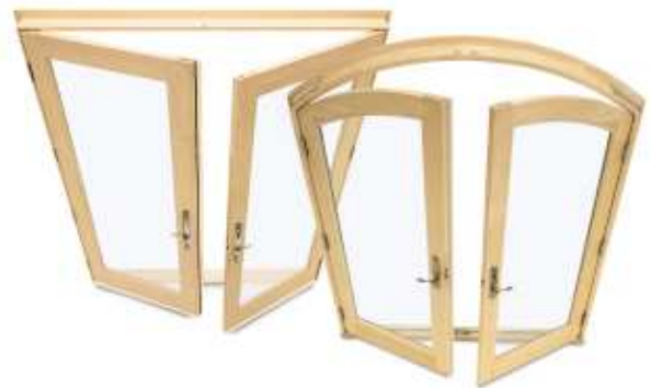
Portes-fenêtres standard et cintrées French & Arch Top French Doors