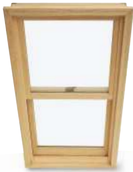
Guillotines Ultimate Double Hung